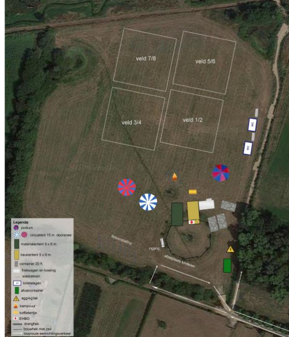
figuur 2. nieuwe terreinindeling